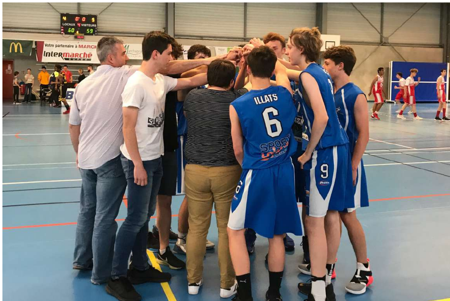
Les U17 garçons, après leur victoire en demi-finale, face à LESPARE, à Marcheprime.

Nouvelle année, nouvelles habitudes ! Nous lançons officiellement le BLEUETS Magazine . Vous y retrouverez tous les résumés de matches et quelques photos !